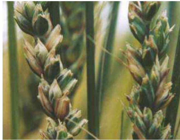
Carie del frumento ( Tilletia caries )

RANCONA™ 15 ME è un fungicida di contatto e sistemico per il trattamento delle sementi che garantisce la protezione del frumento e dell'orzo a semina invernale o primaverile. RANCONA™ 15 ME controlla le principali malattie delle sementi e delle piantine, proteggendo il valore del raccolto.