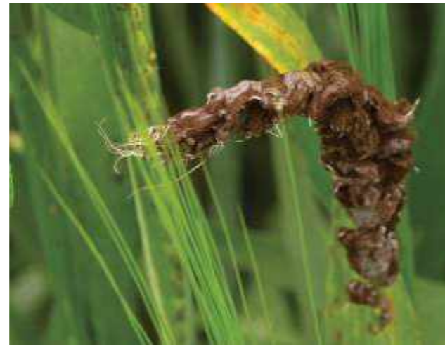
Carbone dell'orzo ( Ustilago nuda )