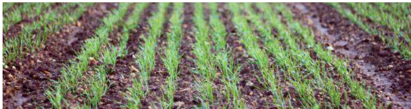
Trattato con RANCONA™ 15 ME

Nel frumento, RANCONA™ 15 ME fornisce un controllo eccellente sia delle malattie del seme che di quelle del terreno ( Tilletia caries ). Nell'orzo consente un ottimo controllo del carbone volante ( Ustilago nuda ) ed il contenimento della striatura bruna ( Pyrenophora graminea ). RANCONA™ 15 ME migliora l'insediamento delle colture e contrasta le malattie del colletto (causate da Microdochium nivale e Fusarium spp.).