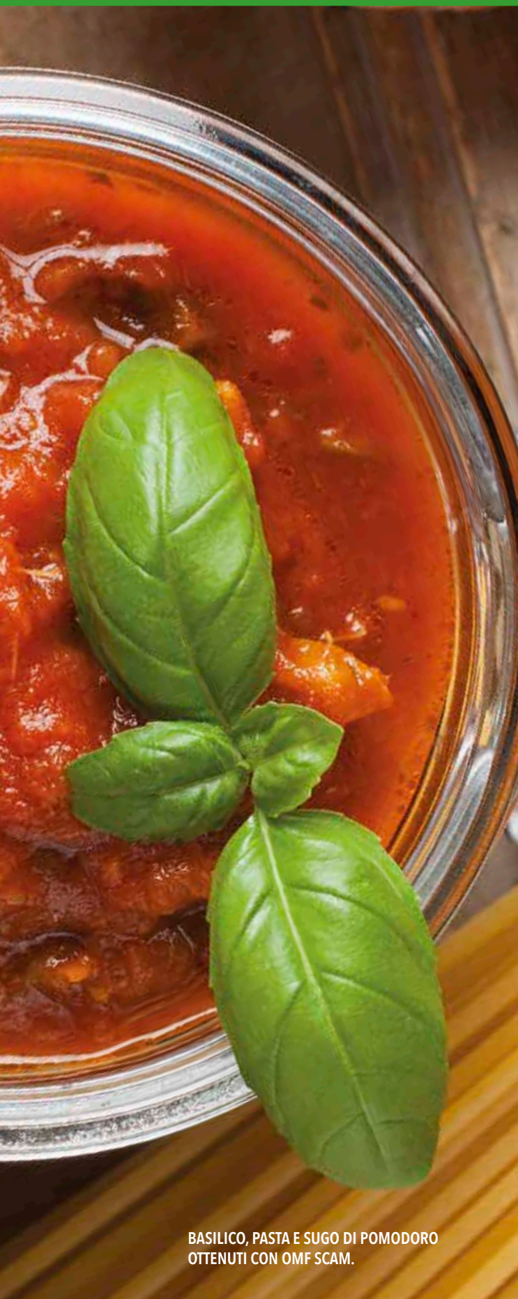
BASILICO, PASTA E SUGO DI POMODORO OTTENUTI CON OMF SCAM.